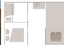
Alter der Unterkunft: 5 Jahre