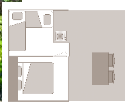
Alter der Unterkunft: 5 Jahre