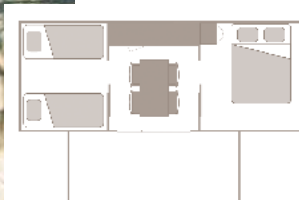
Alter der Unterkunft: 5 Jahre