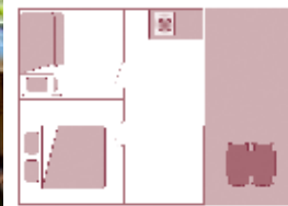
Alter der Unterkunft: 3 Jahre