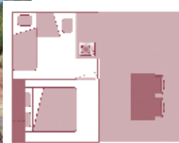
Alter der Unterkunft: 3 Jahre