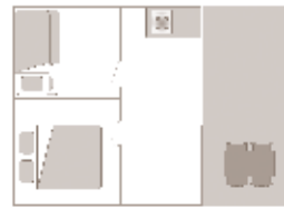
Alter der Unterkunft: 4 Jahre