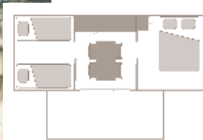
Alter der Unterkunft: 4 Jahre