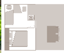
Alter der Unterkunft: 4 Jahre