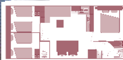
Ancienneté du locatif : 8 à 9 ans