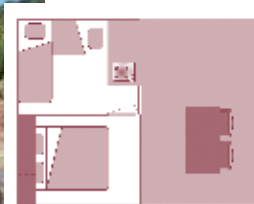
Ancienneté du locatif : 3 ans