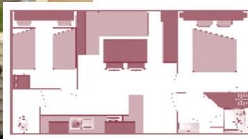
Ancienneté du locatif : 8 à 9 ans