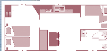
Ancienneté du locatif : 8 ans