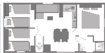
Ancienneté du locatif : 1 an