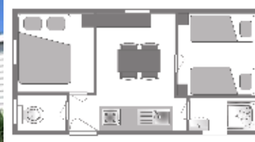
Ancienneté du locatif : 3 à 9 ans