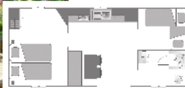
Ancienneté du locatif : 1 an