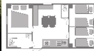
Ancienneté du locatif : 3 à 9 ans