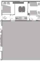
Alter der Unterkunft: 9 bis 11 Jahre