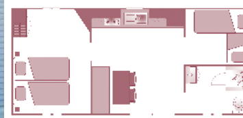
Ancienneté du locatif : 8 ans