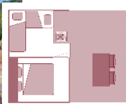
Ancienneté du locatif : 5 ans