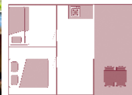
Ancienneté du locatif : 5 ans