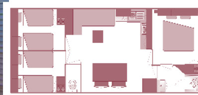
Ancienneté du locatif : 8 à 9 ans