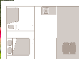
Alter der Unterkunft: 5 Jahre

Alle unsere Mietunterkünfte sind mit Bettdecken und Kissen ausgestattet - Fotos und Pläne unverbindlich