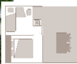
Alter der Unterkunft: : 8 Jahre

Alle unsere Mietunterkünfte sind mit Bettdecken und Kissen ausgestattet - Fotos und Pläne unverbindlich